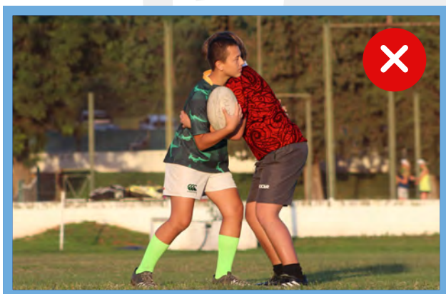
Maul no formado

Mantener la continuidad del juego cuando se hayan agotados las opciones de carreras, kicks y pases.