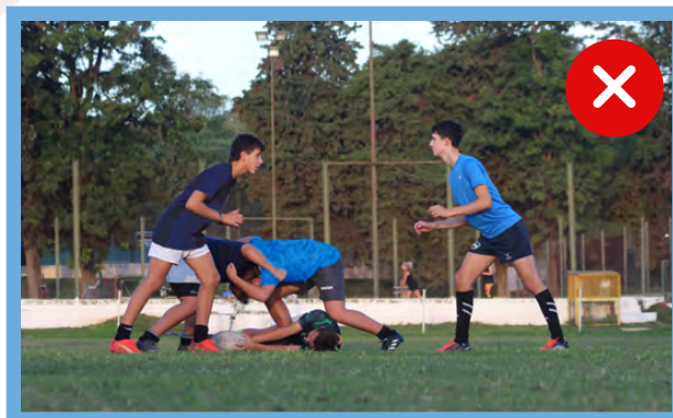
Líneas de offside creadas por un jugador de pie sobre la pelota