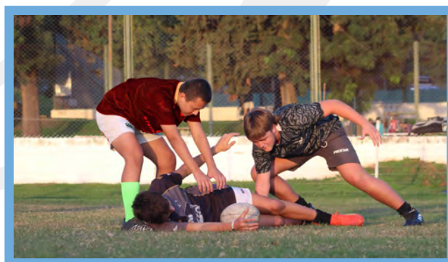
El jugador tackleado debe liberar la pelota inmediatamente